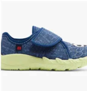
1 Finken / Hausschuhe (geschlossen)