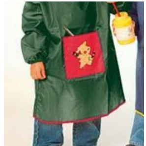
3 Malschürze (auch altes Hemd möglich)