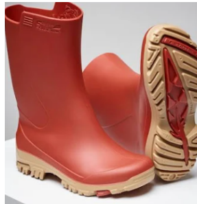
2 Gummistiefel (Name angeschrieben)