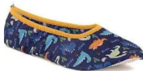
6 Turnschuhe, Turnschlappchen oder ABS Socken (mit Name angeschrieben)

Nr. 5&6 Im Turnbeutel oder Rucksack mitnehmen.