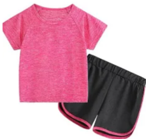
5 Turnhosen & T-Shirt