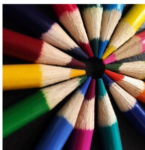
1 FARB- ODER FILZSTIFTE