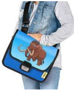
4 oder Kindergartentäschli